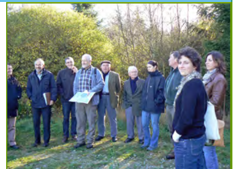
In the Ardennen

Op 13 en 14 oktober 2011 maakten tien vertegenwoordigers van het EPAMA-bestuur een tocht door het Maasbekken om het AMICE-project en ook dat van Maaswerken te leren kennen. Er werd een bezoek gebracht aan het Albertkanaal, HOWABO en het oude centrum van 's-Hertogenbosch, de imposante Grensmaaswerken en de valleien in het Duitstalige deel van de Ardennen. Er was ook een lunch met de Maascommissie.