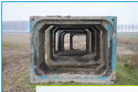
Dit wordt het vleermuizenhuis.

Het werk is bijna klaar! Onlangs zijn de verbindingen met de Mark gemaakt. Het project is nu klaar voor de hoogwaters van de komende winter. Er werd 80.000 m3 grond verwijderd, zodat er nu 3.5 ha meer ruimte is voor het water. Het werk kan nog niet definitief opgeleverd worden, maar de aannemer heeft al zijn materiaal verplaatst en is momenteel in "winterstop". Dit komt omdat er nu geen grond kan gebracht worden op akkers die in gebruik zijn. Wat nu nog moet gebeuren is het verwijderen van de gronddepots en het ombouwen van oude betonbuizen tot woonplaatsen voor vleermuizen. Het vleermuizenhuis wordt ontwikkeld in samenwerking met het Departement Kennis en Ontwikkeling van het Waterschap. Er is overeengekomen dat alle werkzaamheden moeten afgerond zijn tegen 1 maart 2012; dan begint namelijk het broed- en groeiseizoen.