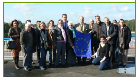
Bij de sluis van Has-selt, op het Albertkanaal

Er waren interessante verschillen met de manier van werken die ze gewoon waren en uit de discussies ontstonden enkele schitterende ideeën.