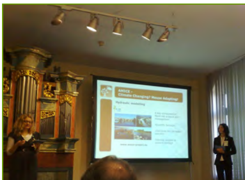
In een van de workshops werd het AMICE project voorgesteld als een goed voorbeeld van grensoverschrijdende samenwerking.