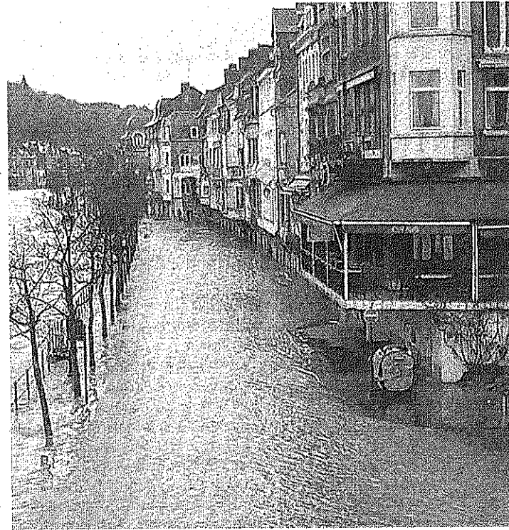
Le record de la crue la plus forte pourrait être battu d'ici 2050.

Une occasion d'étudier les schémas de communication entre la Belgique et la France mais aussi entre les différentes forces vives impliquées dans la gestion des inondations. Et aussi d'évaluer les risques de dommages et de tester les différents outils informatiques utilisés dans pareille situation. «