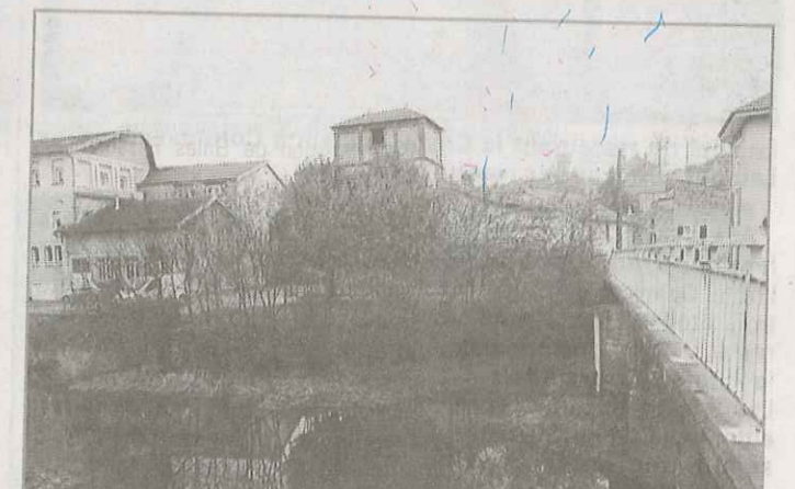
Comme le confirmait le site Vigicrues, tout était parfaitement normal hier à Neufchâteau.